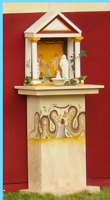
Hausaltar „Brot und Spiele 2007“ in Trier