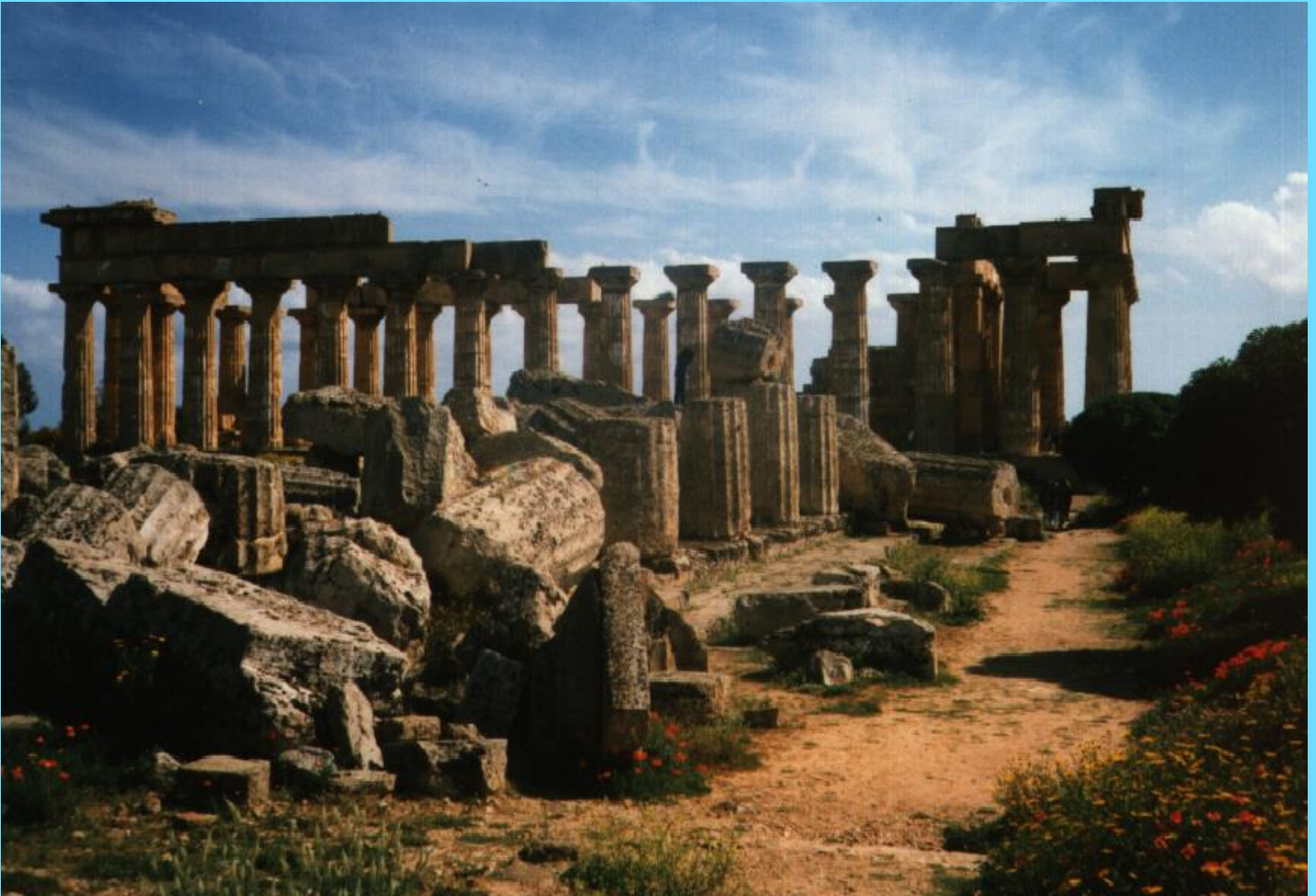
Tempel in Selinunte