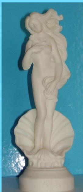
Venus / Aphrodite