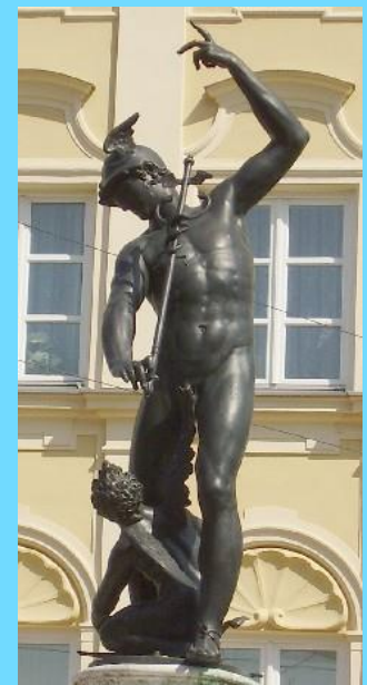
Merkur / Hermes in Augsburg